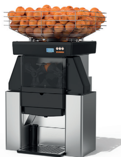
Z40 Nature Counter Top

A capacidade da cesta abastecedora e dos depósitos de cascas existentes no móvel de aço inox, possibilita seu uso para auto-serviço, buffets, restaurante, comida por kilo e muito mais.