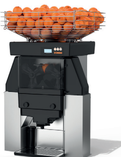
Z40 Nature Self Service

Com seu cesto abastecedor de frutas com capacidade para 150 frutas no automático, permite autonomia para grandes volumes, principalmente para quem tem a intenção de engarrafar.